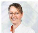
Moderatie: J. Stoffels Internist - ouderengeneeskunde AUMC